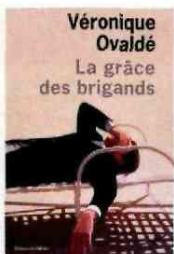
Véronique Ovaldé, Editions de l'olivier, 19,50 € Sortie le 22/08

Ce roman-fleuve est l'un des titres les plus attendus de la rentrée littéraire. Au fil de ses 700 pages et de ses allers-retours dans les appartements de la place bruxelloise, l'auteur explore tous les leviers de la sexualité et de la sensualité. Torride.