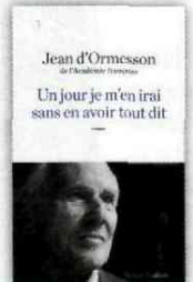
Jean d'Ormesson, Robert Laffont, 21 € Sortie le 22/08

A travers l'histoire de cet ado mal dans sa peau, l'auteur nous offre un roman d'apprentissage puissant.