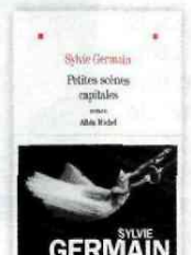
Sylvie Germain, Albin Michel, 19 € Sortie le 21/08

Entre éducation sentimentale et récit initiatique, ce nouveau roman de l'auteur de L'Attentat ne déçoit pas !