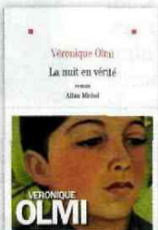
Véronique Olmi, Albin Michel, 19 € Sortie le 21/08

Histoires de famille, grâce de l'humour et retournements inattendus pimentent ce roman qui happe le lecteur.